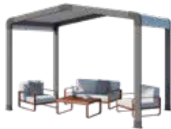
Espace de détente