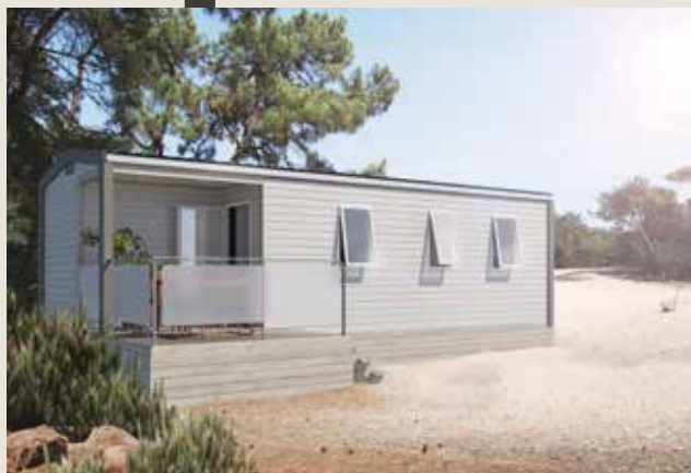
Modèle présenté avec l'option rambarde métal et toile