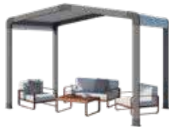
Espace de détente