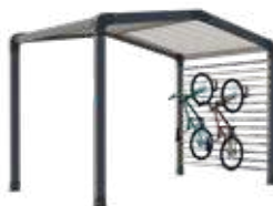
Range-vélos et/ou stockage